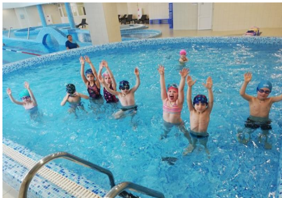
плавание для малышей 3-5 лет

Численность занимающихся более 500 семей (1500 человек)