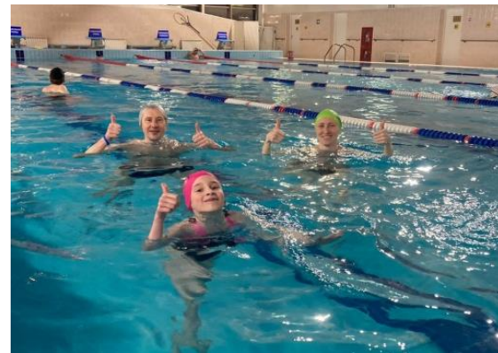
плавание «Мама, папа, я!»